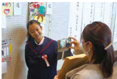
▲作品と一緒に記念撮影！