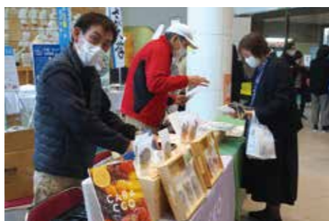
▲蓮花の会さんによるバザーも