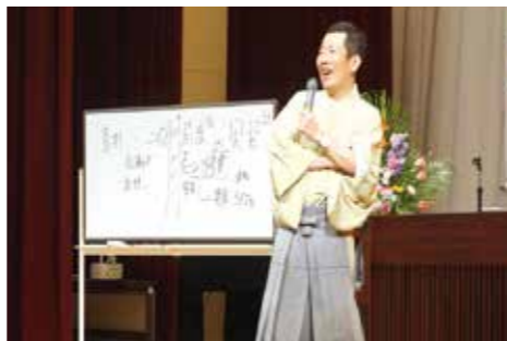
▲父の名を継いで17年目に入りました