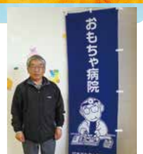
白石おもちゃ病院開設 毎月第2土曜日 (10:00~14:00)