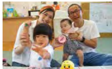
令和5年度も開催決定!