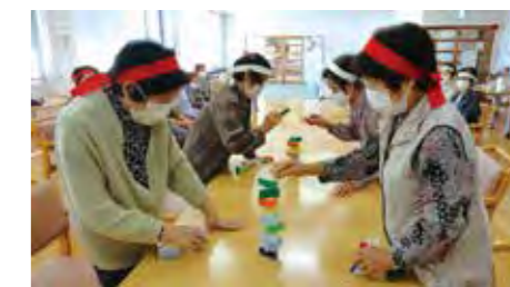
「ここが一番楽しか!」と仰っていたいます