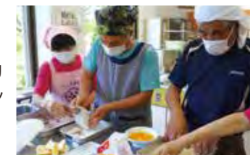
皆さんも料理を習いませんか? 楽しいですよ!

台所に立つ機会が少ないシニア男性を対象に、町食生活改善推進協議会の協力を得て、男性料理教室を年2回開催しました。アジフライやカレー作りにチャレンジしてもらい、調理の楽しさを体感してもらいました。