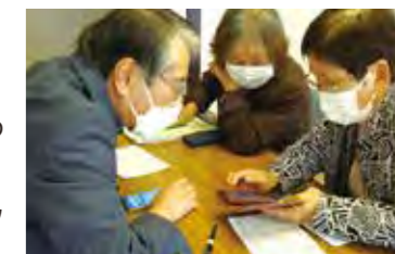
人気のスマホ講座

なお、受講者には避難情報や気象情報など災害時等の情報源としての「防災ネットあんあん」にその場で登録してもらいました。