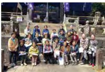
みんなでお出かけ! (白石健康サロン)