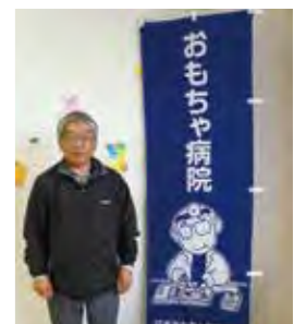
白石おもちゃ病院開設 毎月第2土曜日