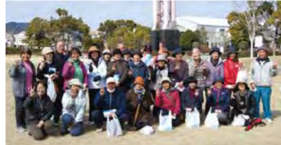
会員によるレクリエーション交流会