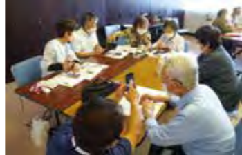
初めてのスマートフォン講座