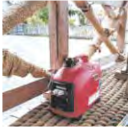
山車飾りを灯す発電機

民生児童委員(主任児童委員)71名に、地域住民の相談援助や歳末お元気ですか運動、救急医療情報キットの申請・配布など地域福祉のあらゆる面でご協力いただきました。