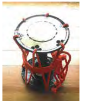
浮立の道具の修理も行いました