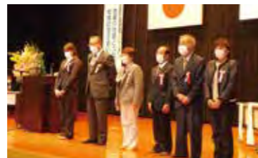
町の福祉にご貢献いただいた方々を表彰