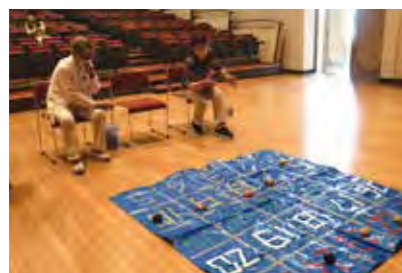
サロンでできるレクリエーションの紹介