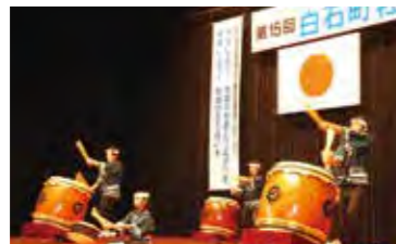
勇壮な太鼓の演奏