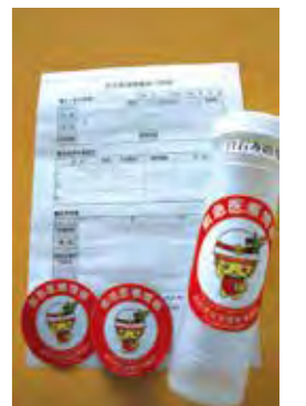
あなたに代わって命の情報を伝えます