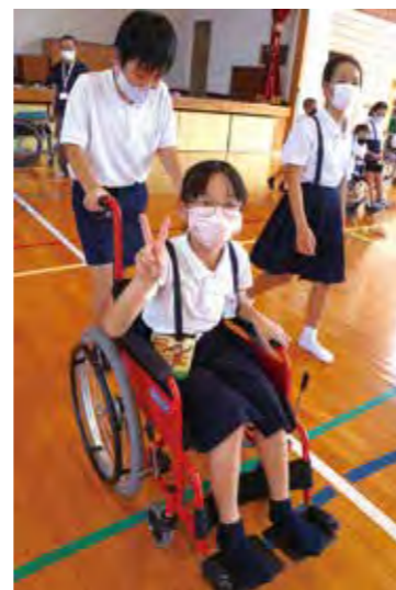
車イス体験も行いました(福富小4年生)

サロン等のつどいの場がより楽しく充実することを目指し、いろいろな特技や知識を持った町民の登録を促し、レクリエーションや歌、体操など得意な分野で協力していただく取り組みを行いました。