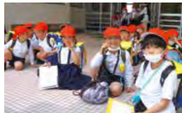
子どもたちの健やかな成長を願って

令和5年度予定の新入学児童の健やかな成長を願って、2月の各校保護者説明会の際にお祝いメッセージと一緒に紅白帽子162個を贈呈しました。