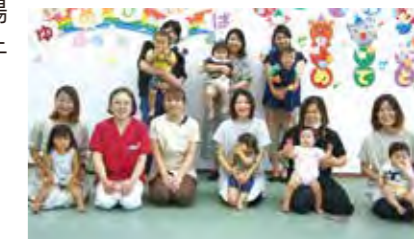
お母さんたちの情報交換の場になっています