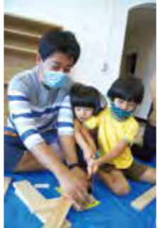
親子で物づくり体験(木工教室)