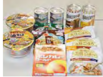
生活再建を願い、お届けしました

白石町内に居住する低所得者(急な解雇や病気等により生活困窮に陥った方)等が、一時的に食料等の生活に必要なものを確保できなくなった場合に、その食料等の現物を給付することで、生活再建に向けた支援を行いました。 1名あたり5,000円分までの現物支給。12世帯に合計19回の支援を行いました。(セブンイレブンジャパン様からの支援物資提供も行いました)