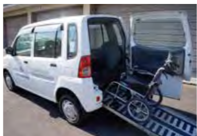
車いす仕様車に対応します