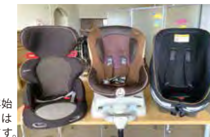
夏休みや年末年始などのシーズンは予約が殺到します。