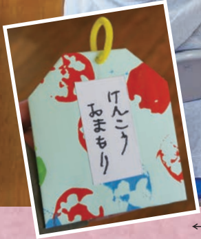
←園児からのプレゼント「けんこうおまもり」