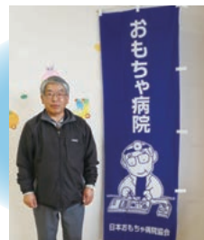
白石おもちゃ病院開設 毎月第2土曜日