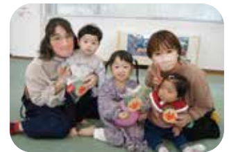
12月21日「読み聞かせの日 &クリスマス会」