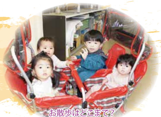
お散歩ほどまで? ひよこぐみの仲良し4人組